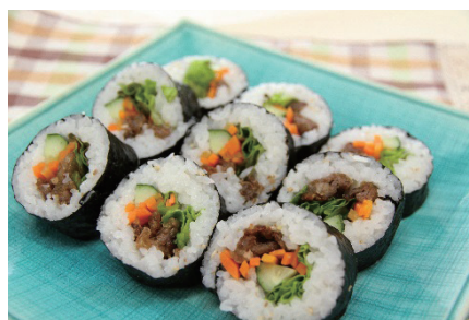
(以下すべて左から掲載月号) 4月号・5月号