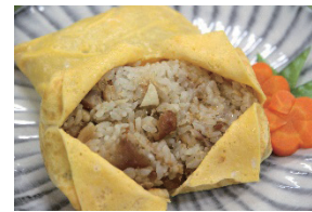
11月号(2品目)・12月号・1月号