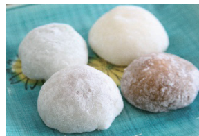
9月号・10月号・11月号(1品目)