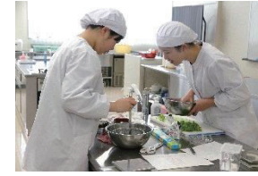
3月号(2品)・調理の様子