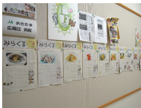
写真1 広報誌の掲載ページを栄養大1Fの掲示板で紹介

J A山形おきたまより、レシピは好評価をいただいております、組合員の方からも、参考にしているという声を聞いている。地域との活動を進めることは学生にもよい刺激となり、自分たちが考えたレシピが載ることで、学生のモチベーションがアップし、積極性も培うことができていると思われる（写真1）。本事業は平成29年3月号までの予定で進めており、今後も、新しい発想の食べ方を提案し、少しでも農産品の消費拡大に寄与できるように心がけていきたいと考えている。